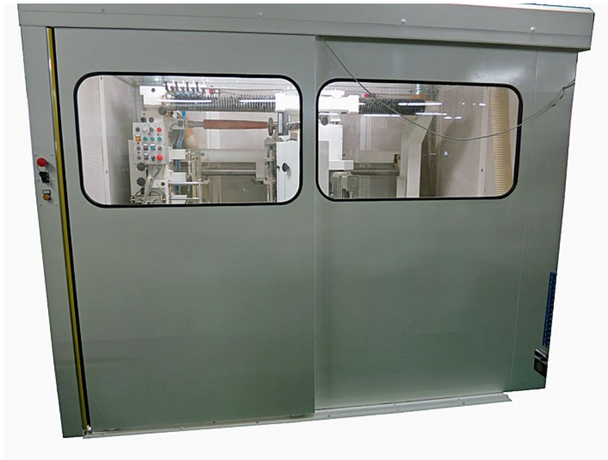
T4M-O 防音・防塵 カバー付 欧州 CEルール内